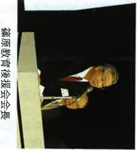
篠原教育後援会会長